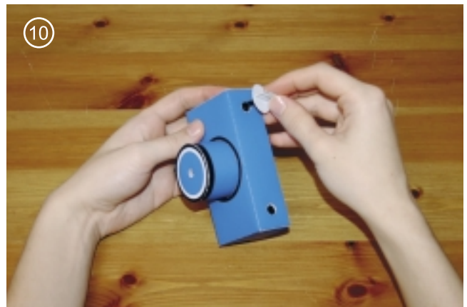
10. Собрать фотоаппарат и вставить детали номер 6 так, чтобы они могли крутить бобины.