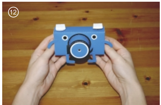
12. Полный оборот детали номер 6 против часовой стрелки на 360 градусов, это один кадр. Затвор нужно открывать при ярком солнечном дне на пол секунды.