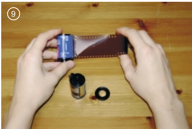
9. Разобрать пустую бобину. Вставить в нее пленку.