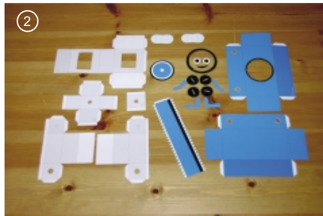
2. С помощью линейки и ножниц сделать сгибы.