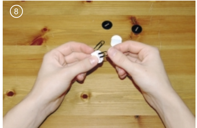
8. Вклеить скрепки