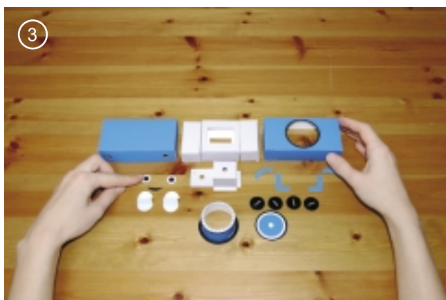
3. Аккуратно склеить.