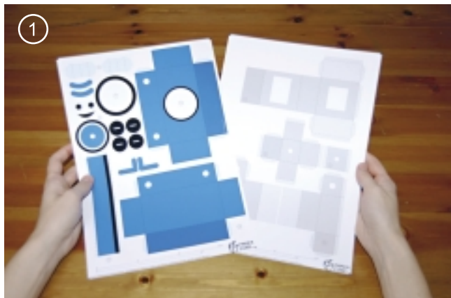
1. Распечатать и разрезать.