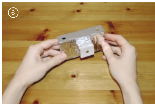
6. Поверх фольги приклеить деталь номер 3. Это будет механизм затвора. Приклеивать нужно не очень плотно, чтобы затвор закрывался и открывался без усилий.