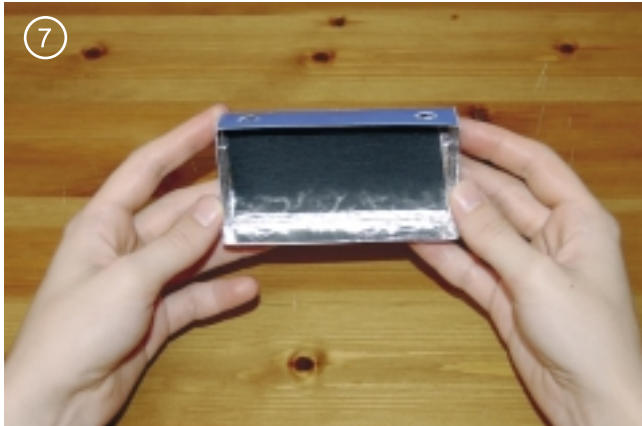
7. Деталь номер 7 с внутренней стороны обклеить фольгой и поверх приклеить темный матовый кусок картона.