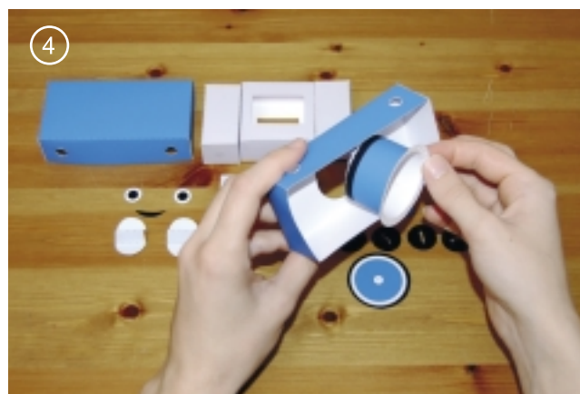
4. Внешний объектив (деталь номер 11) приклеить с внутренней стороны.